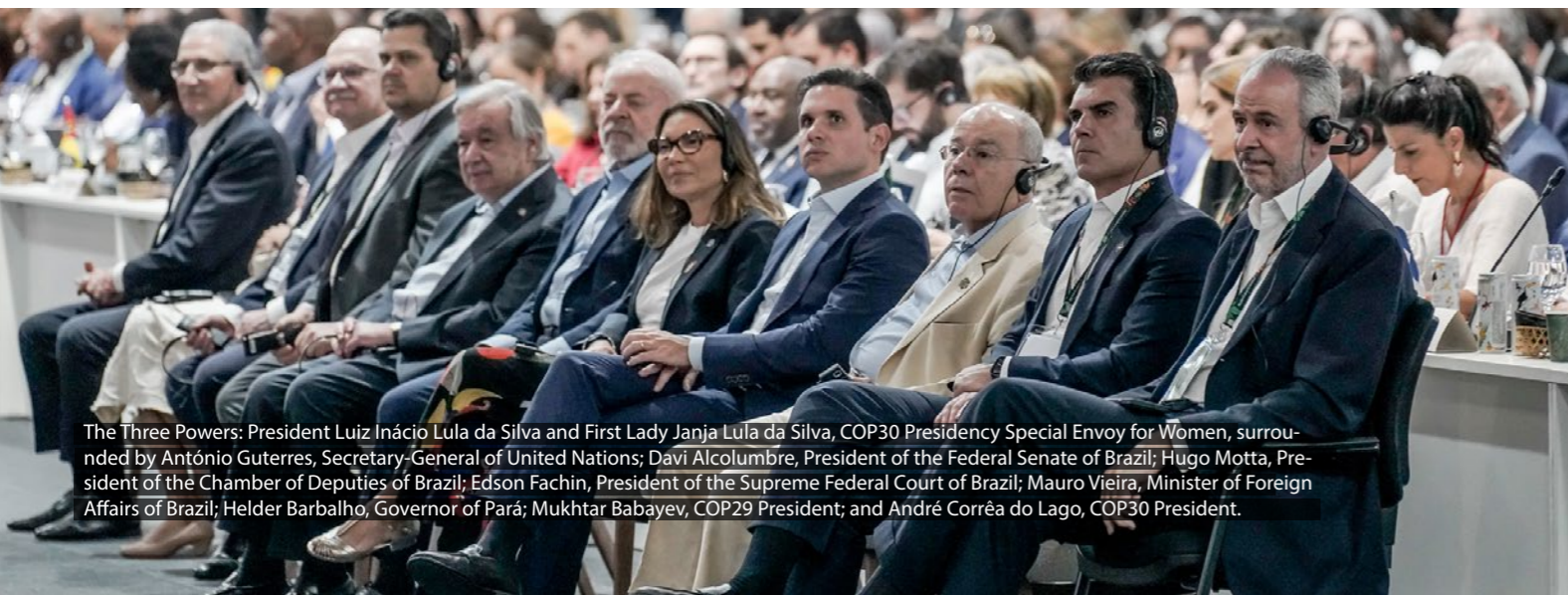
The Three Powers: President Luiz Inácio Lula da Silva and First Lady Janja Lula da Silva, COP30 Presidency Special Envoy for Women, surrounded by António Guterres, Secretary-General of United Nations; Davi Alcolumbre, President of the Federal Senate of Brazil; Hugo Motta, President of the Chamber of Deputies of Brazil; Edson Fachin, President of the Supreme Federal Court of Brazil; Mauro Vieira, Minister of Foreign Affairs of Brazil; Helder Barbalho, Governor of Pará; Mukhtar Babayev, COP29 President; and André Corrêa do Lago, COP30 President.

A Cúpula de Belém foi planejada como um catalisador para impulsionar ações concretas, buscando promover convergências sobre prioridades estratégicas que possam orientar e fortalecer os resultados da COP30. O Presidente Lula destacou a Cúpula como um momento que combina urgência e oportunidade. Coincidindo com o 80º aniversário das Nações Unidas e com os dez anos da adoção do Acordo de Paris, 2025 representa, segundo ele, um momento que exige “coragem e transparência”. O Presidente Lula defendeu que esta fosse “a COP da verdade”, ressaltando que a crise climática não poupa nenhum país, região ou comunidade.